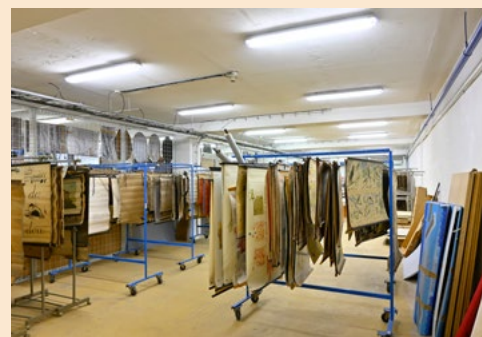
Depozitář Historické podsírkky, oddělení didaktických školních obrazů

z projektů, který kráčí tímto směrem, je publikační edice Vzácné školní obrazy vydávaná od roku 2010. V tomto roce by měl vyjít již osmý díl věnující se zoologickým obrazům, které na svých barevných litografiích vydávala počátkem 20. století dvojice autorů Schröder-Kull.