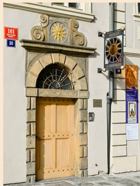
Národní pedagogické muzeum a knihovna J. A. Komenského

Vzhledem k tomu, že naše mimořádná sbírka obsahuje kolem 8 tisíc českých i zahraničních výukových obrazů, naším dlouhodobým cílem je jejich co možná nejširší prezentace. Jedním