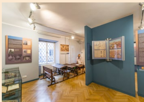
Interiér jedné z výstavních místností muzea