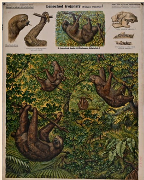
Školní didaktický obraz: Lenochod trojprstý, Schröder-Kull: Biologické obrazy živočišnopisné tab. 70, 1. třetina 20. st.

Úkolem kurátorů jednotlivých fondů je nejen pečovat o toto dědictví tak, aby bylo zachováno pro další generace, ale též je rozvíjet novými akvizicemi, dokumentovat, vědecky zpracovávat a v rámci nejrůznějších projektů představovat veřejnosti.